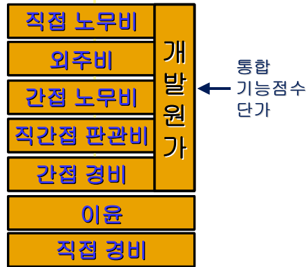
그림 3. 기능점수 당 단가 구조 Fig 3. Unit Cost per Function Points

앞에서 기술한 것처럼, 소프트웨어 대가산정 가이드의 개발비 단가는 개발 기능점수 당 단가이며, 이 단가는 2004년 사업대가기준을 분수 방식에서 기능점수 방식으로 바꾸는 혁명적인 과정에서 대형 SI 업체들이 기존에 수행했던 프로젝트 자료에 근거하여 유도된 기능점수 당 평균 단가로 대가산정 가이드의 개정 시에 수정을 거듭하고 있으며, 그림 3과 같은 요소를 포함한다[7].